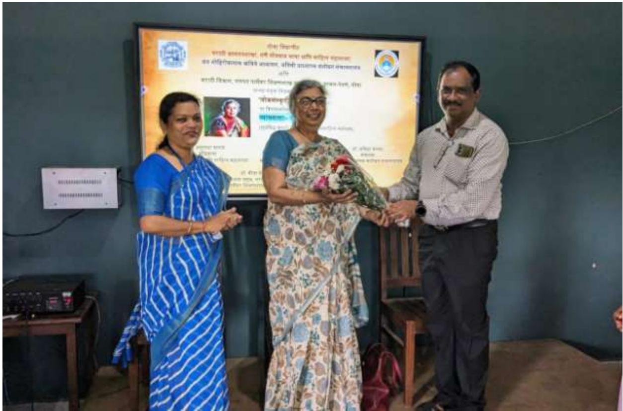
Ganpat Parsekar College, Harmal