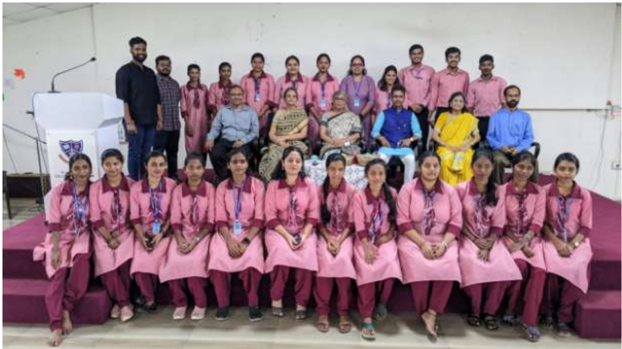
GVM's B.Ed College, Farmagudi