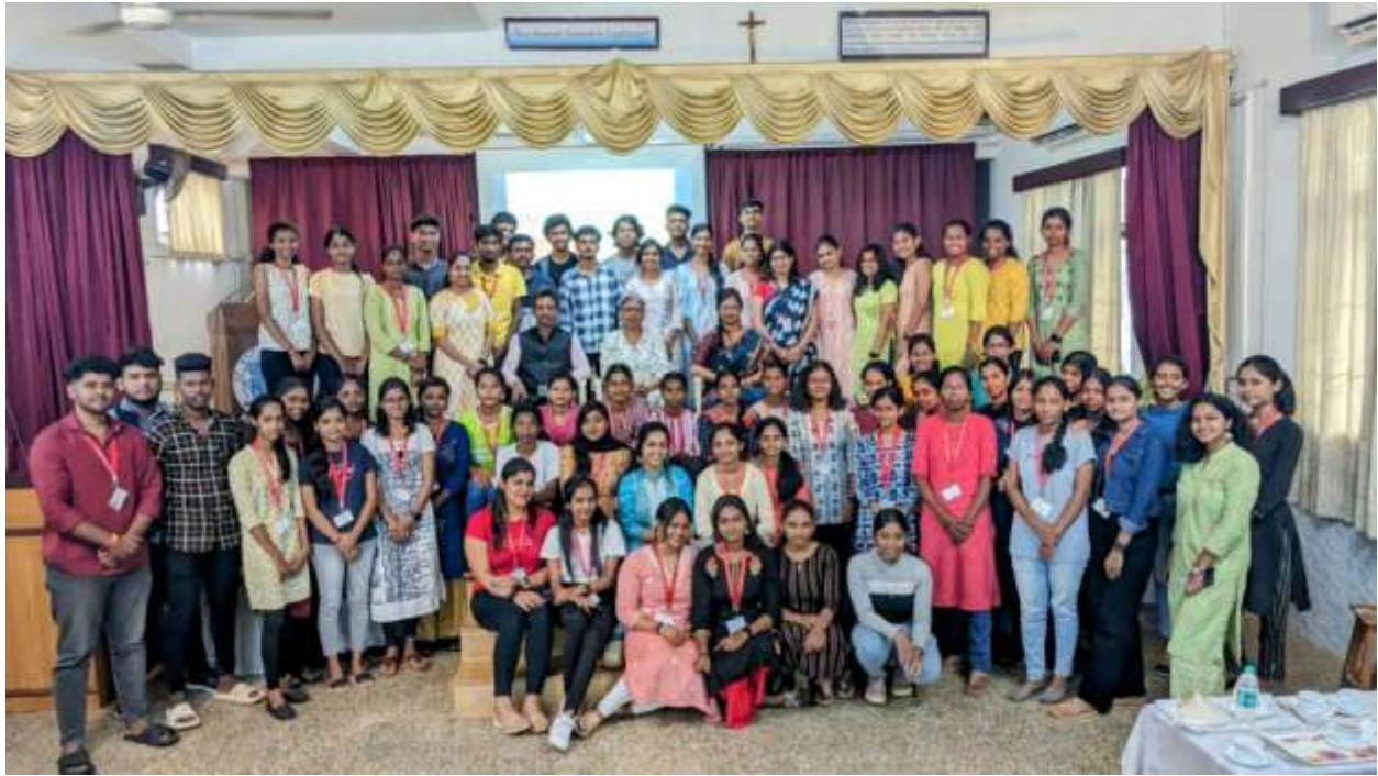
Saint Xevier's College, Mapasa