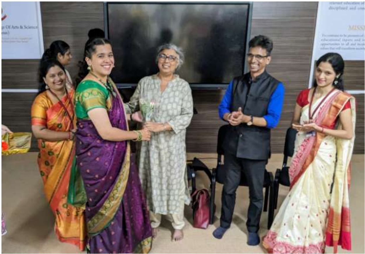
Parvatibai Chowgule College, Madgao