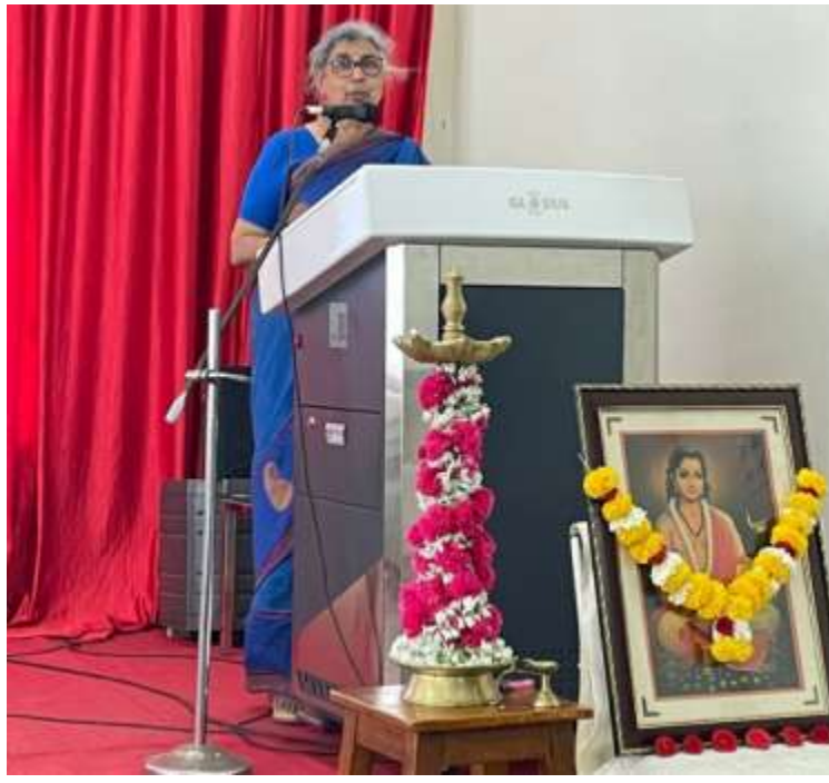
Sant Sohirobanath Ambiyev Govt. College, Pedne