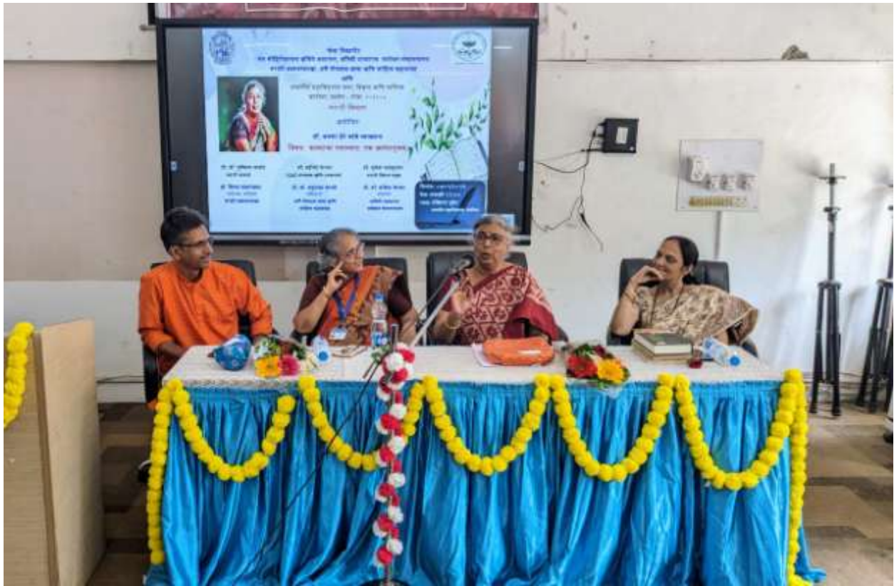
Government College Khandola