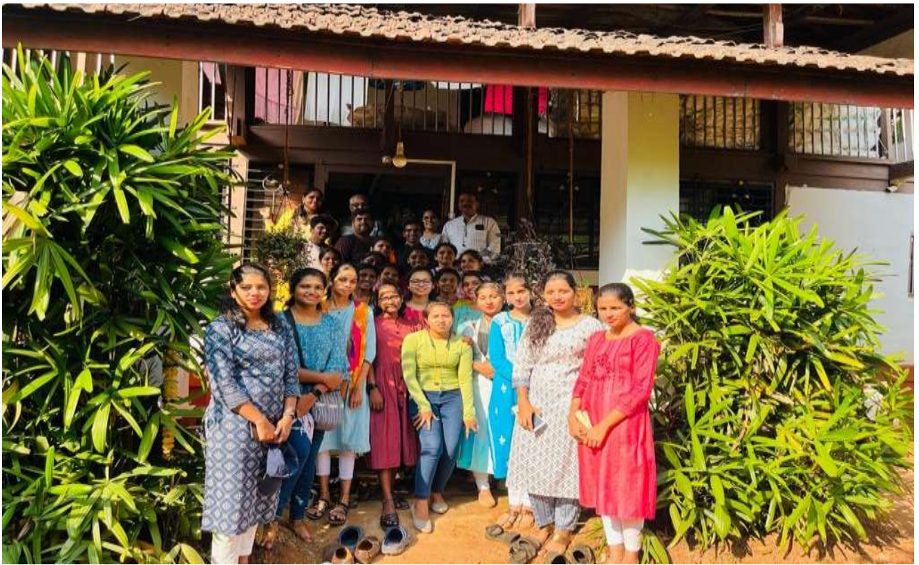
House of Marathi Author Jayavant Dalavi