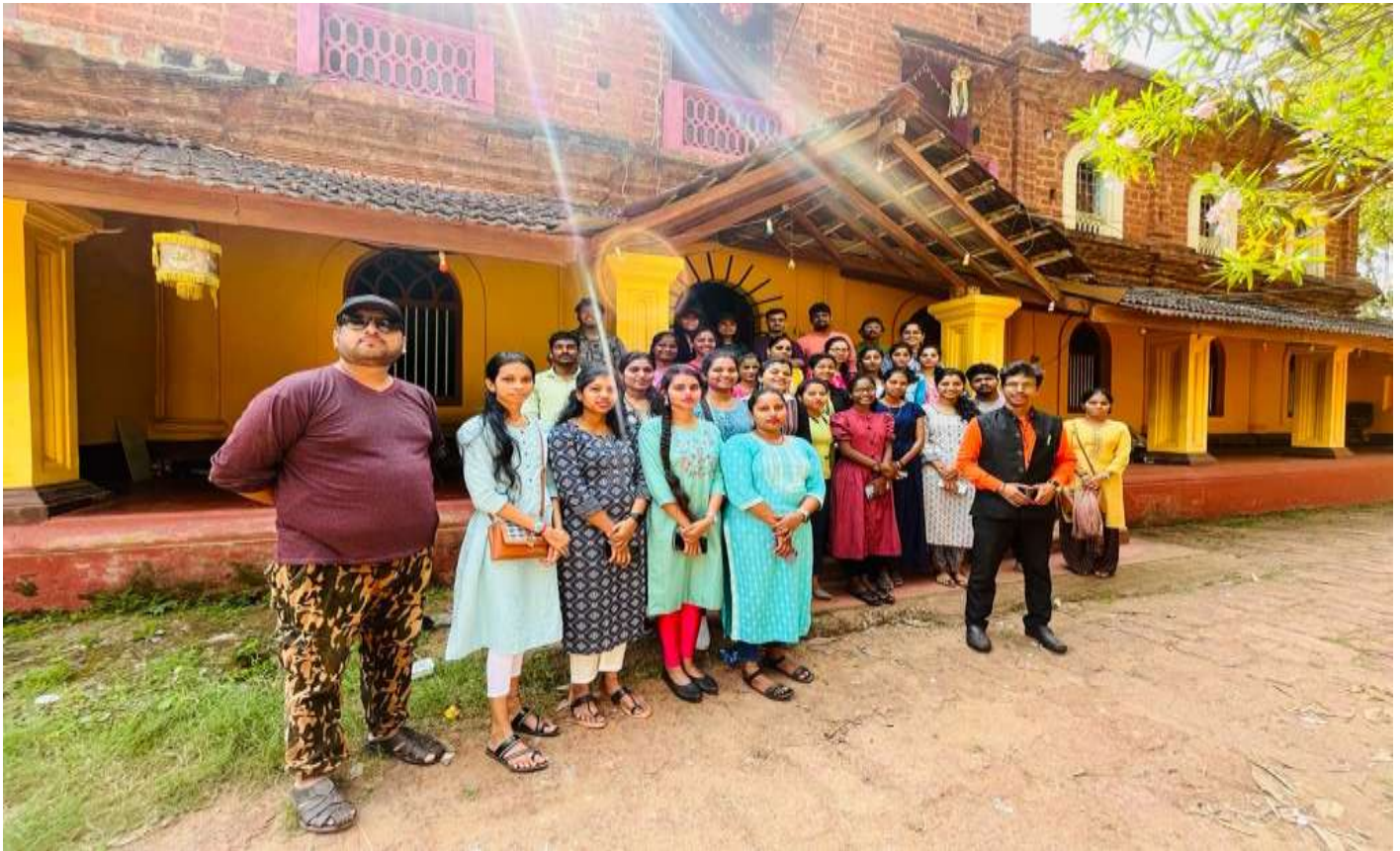
The mansion of the mighty warrior Jivbadada Kerkar