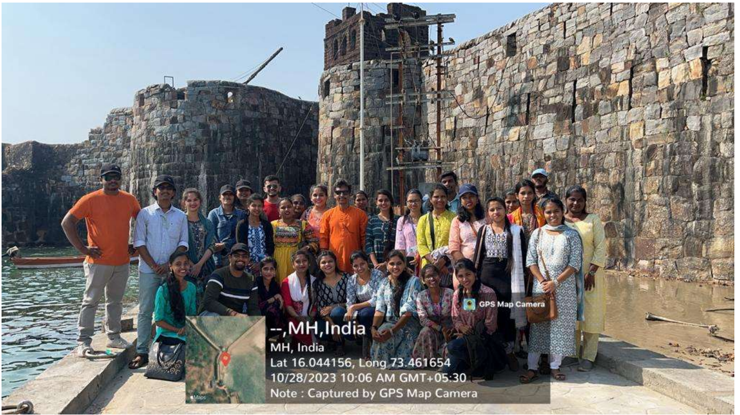
Visited the Sindhudurg fort built on the orders of Chhatrapati Shivaji Maharaj for sea border security as well as for the Maratha navy.