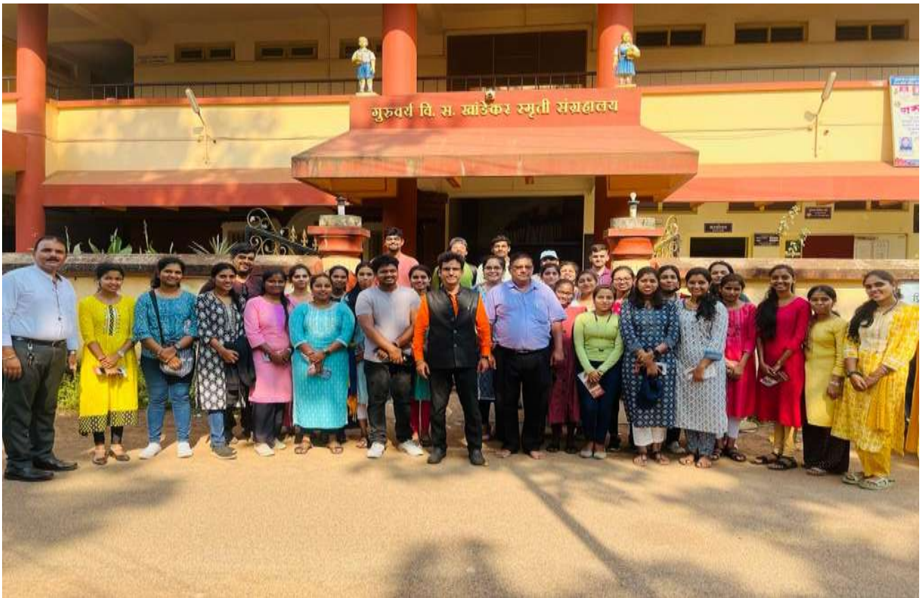
Marathi writer V. S. Khandekar : A school and Museum