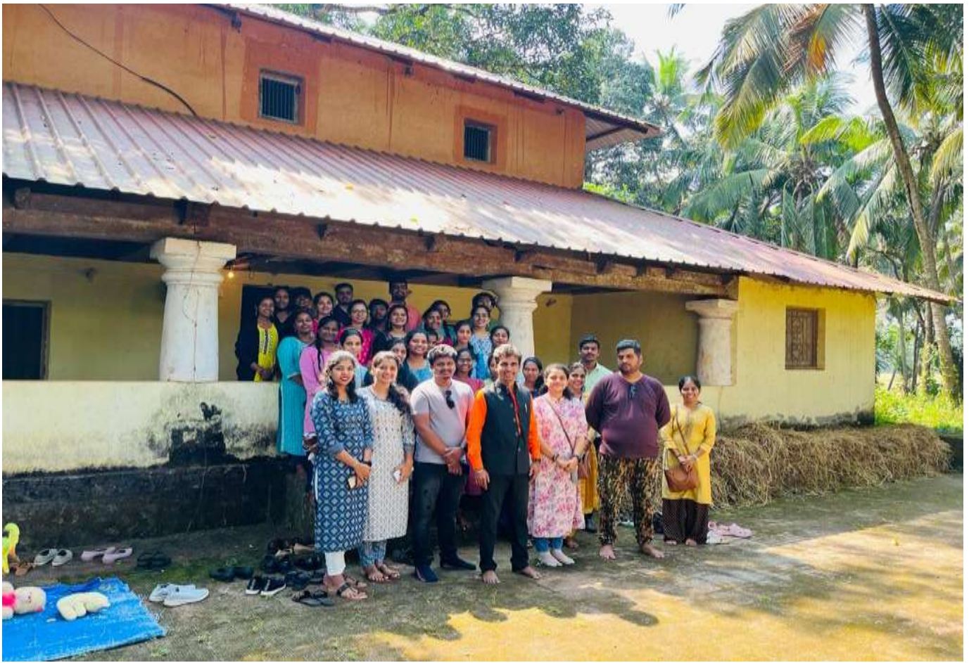
House of Sant Sohirobanath Ambiye