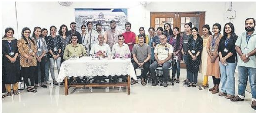
गोवा विद्यापीठातील दिवाळी अंक वाचनोत्सव कार्यक्रमाला उपस्थित मान्यवर.

गोवा विद्यापीठातील मराठी अध्ययन शाखा आणि गोवा विद्यापीठ ग्रंथालय यांच्या संयुक्त विद्यमाने आयोजित दिवाळी अंक प्रदर्शन आणि वाचन महोत्सव कार्यक्रमात प्रमुख पाहुणे या नात्याने ते बोलत होते.